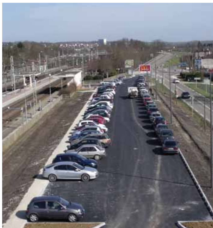
L'aménagement du parking sud de la gare (route de Paroy-sur-Tholon) se termine. 85 places dont 5 pour personnes à mobilité réduite ont ainsi été créées.