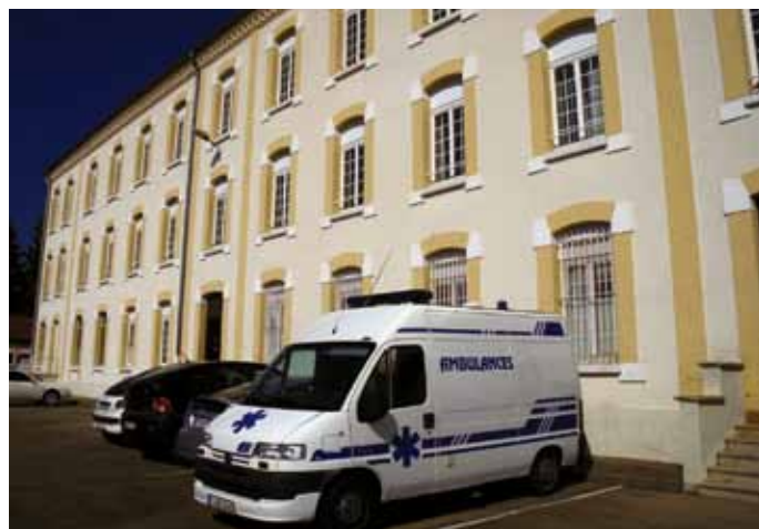
Le bâtiment du pôle formation (ex bâtiment d'Etat-major) de l'ancien site militaire.