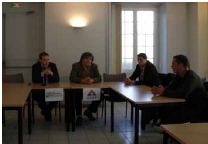
Rencontre avec les responsables des organismes de formation Poinfore et Claf Accompagnement vendredi 9 mars.

Adjoint au maire chargé de la formation Président de la communauté de communes du Jovinien