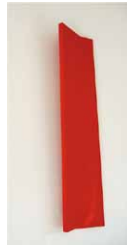
Oeuvre de Madé, peintre sculpteur, exposée à l'atelier Cantoisel

Lorain Gallery - art moderne et contemporain - mobilier design - 12 bis quai Leclerc du mercredi au samedi de 10h à 12h30 et de 14h30 à 19h - également sur RDV tél. 03 86 73 75 53