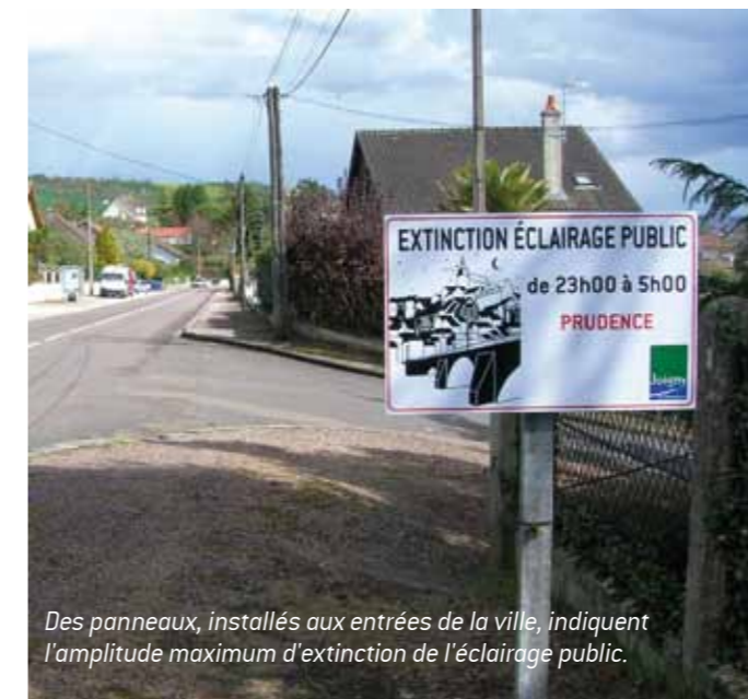
Des panneaux, installés aux entrées de la ville, indiquent l'amplitude maximum d'extinction de l'éclairage public.

Adjointe au maire chargée de l'environnement