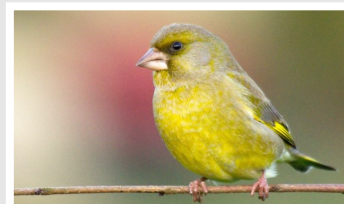
↑ Verdier d'Europe