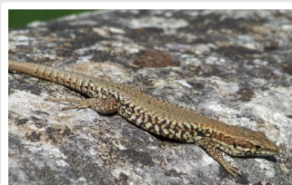
↑ Lézard des murailles