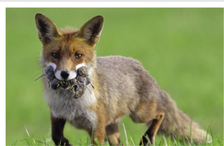
↑ Renard roux