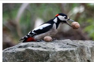
↑ Pic épeiche