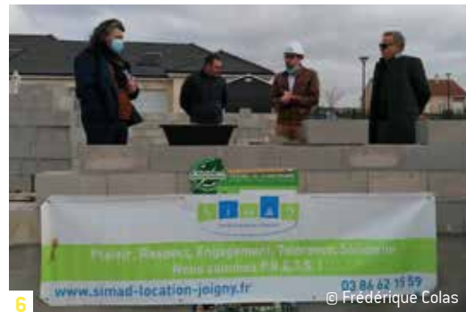
6 © Frédérique Colas