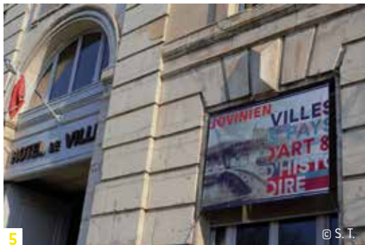
5 © S. T.