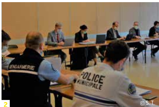
2 © S. T.