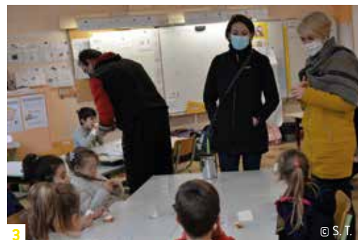
3 © S. T.