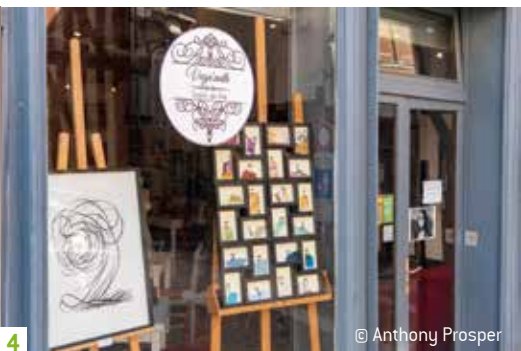
4 © Anthony Prosper