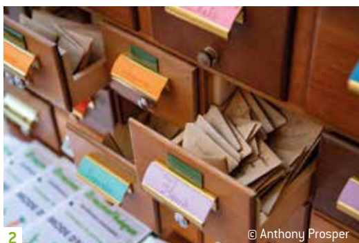
2 © Anthony Prosper