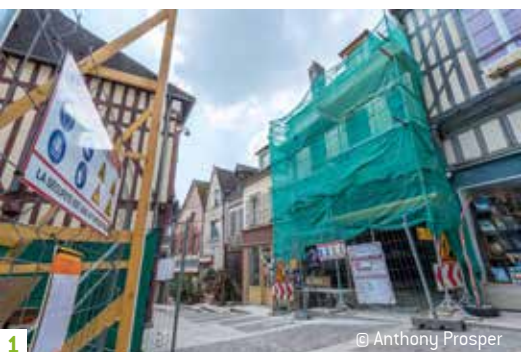
1 © Anthony Prosper