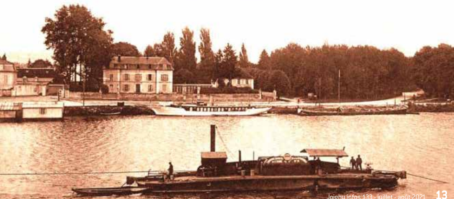
JOIGNY (Yonne). - Sous-Préfecture et chemin du Chapeau Vue prise de la rive droite