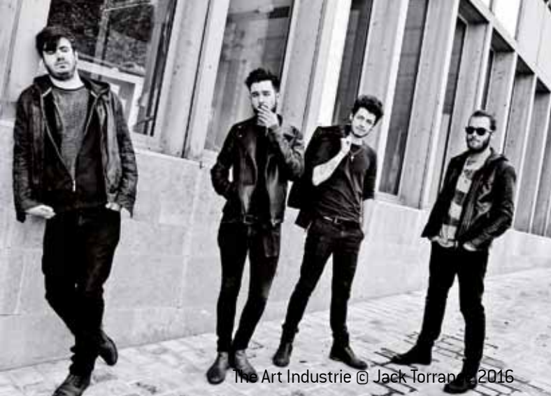
The Art Industrie © Jack Torrance, 2016