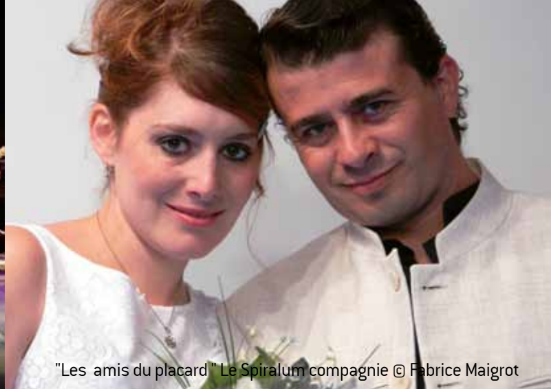
"Les amis du placard" Le Spiralum compagnie