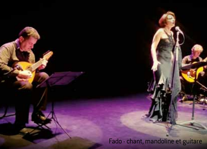
Fado - chant, mandoline et guitare