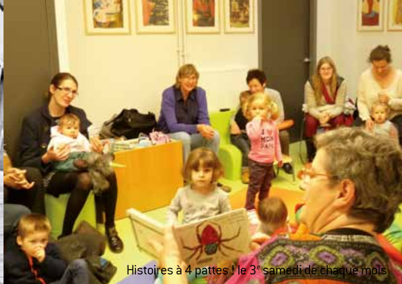
Histoires à 4 pattes ! le 3 e samedi de chaque mois